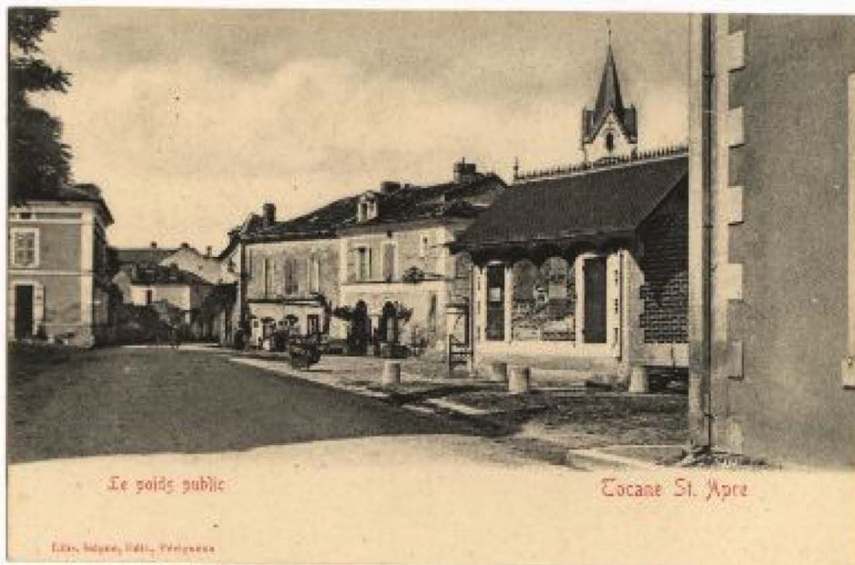
Document 1 : ADD24 5Fi Tocane Saint Apre