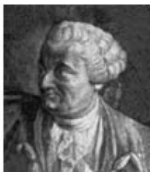
César-François dit Cassini III

La carte de Cassini ou carte de l'Académie est la première carte générale du royaume de France. Il serait plus approprié de parler de carte des Cassini , car elle fut dressée par la famille Cassini, principalement César-François Cassini (Cassini III) et son fils Jean-Dominique Cassini (Cassini IV) au XVIII e siècle.