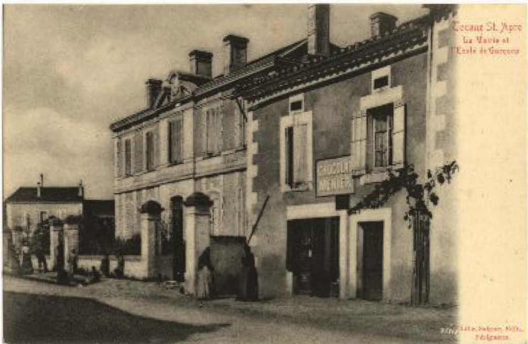
Document 4 : Carte postale ADD 24 5Fi Tocane saint Apre

Approfondissement à partir du document 4