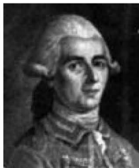
Jean-Dominique dit Cassini IV

1 – Complète le tableau suivant. Nom des villages ou hameaux au XVIII e siècle Nom des villages actuels