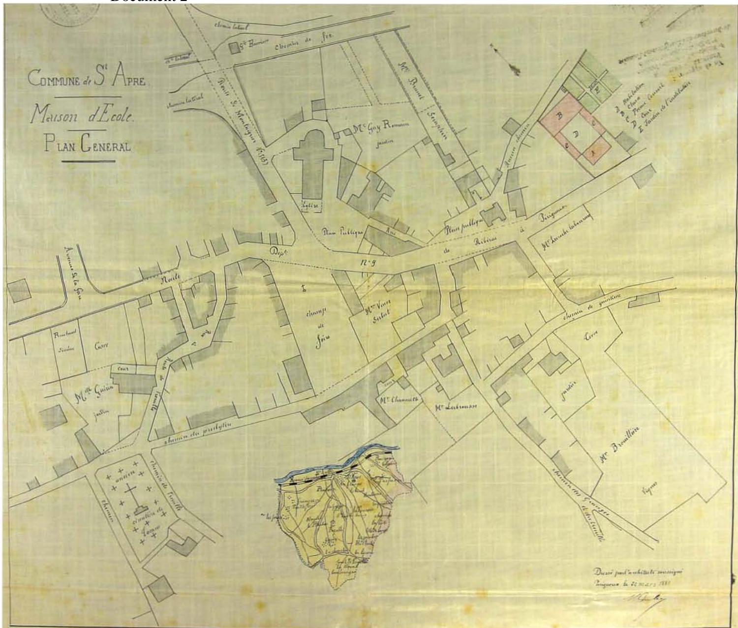
Document 2 : Plan du 22 mars 1881 ADD 24 10 O 121 Tocane Saint Apre