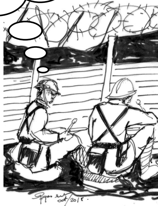
Dessin original de Georges Sarlat