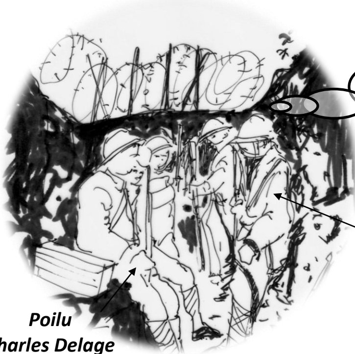
Poilu Charles Delage