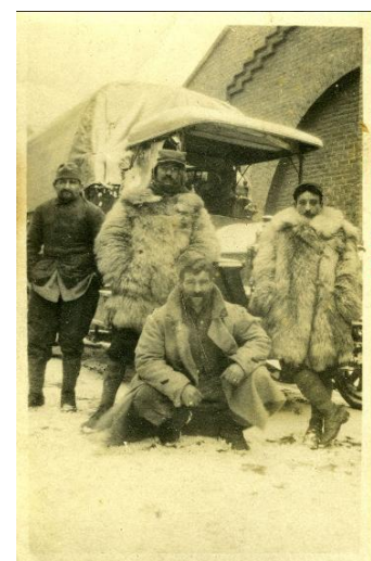
AD 24 : 1 Num 66 001

Aux Archives départementales, les documents peuvent être sous format papier mais aussi -----