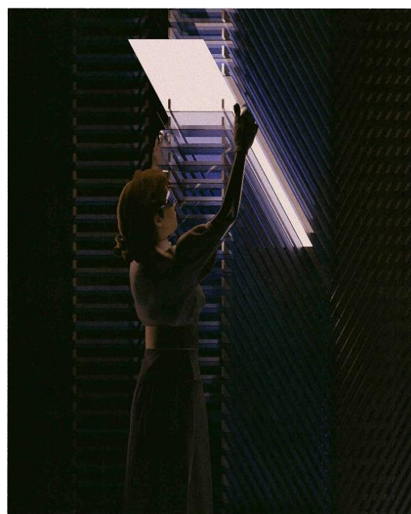
BIENVENU Ugo, © Archiviste, 2021.