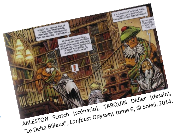
ARLESTON Scotch (scénario), TARQUIN Didier (dessin), "Le Delta Billeux" , Lanfeust Odyssey, tome 6, © Soleil, 2014.