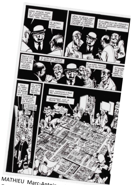
MATHIEU Marc-Antoine, Mémoire morte , ©Delcourt, 2000.

200 x 100 cm Une forteresse inexpugnable