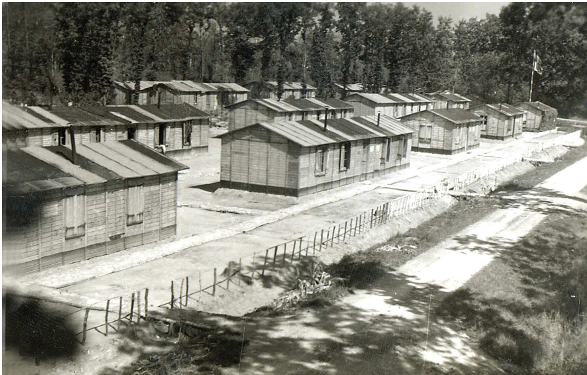
Camp Bao Dai à La Ferté (Saône et Loire), vers 1943. Le camp a été construit pour héberger les travailleurs indochinois envoyés couper le bois. Dans une baraque logeaient une soixantaine de travailleurs.