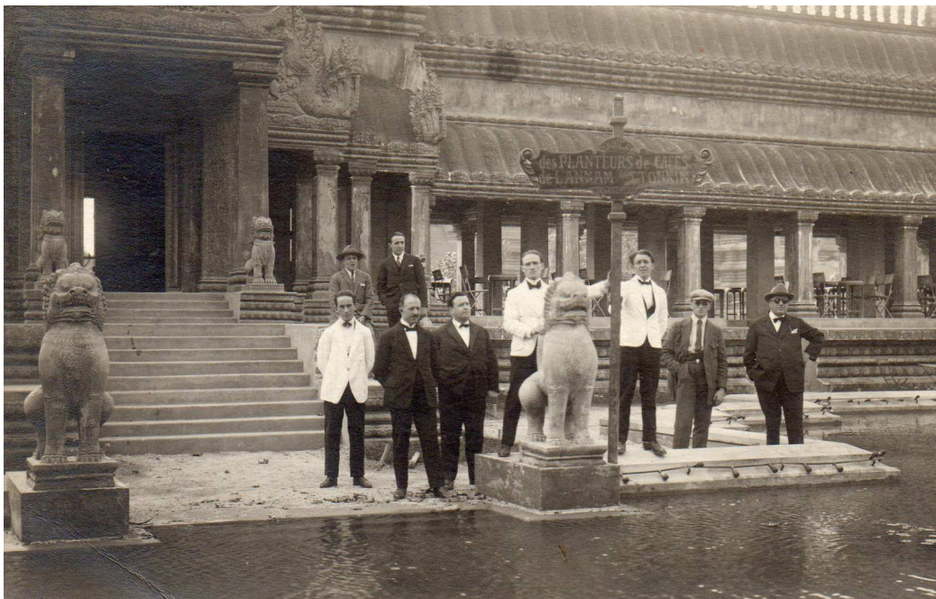
Carte postale de l'Indochine vers 1920.