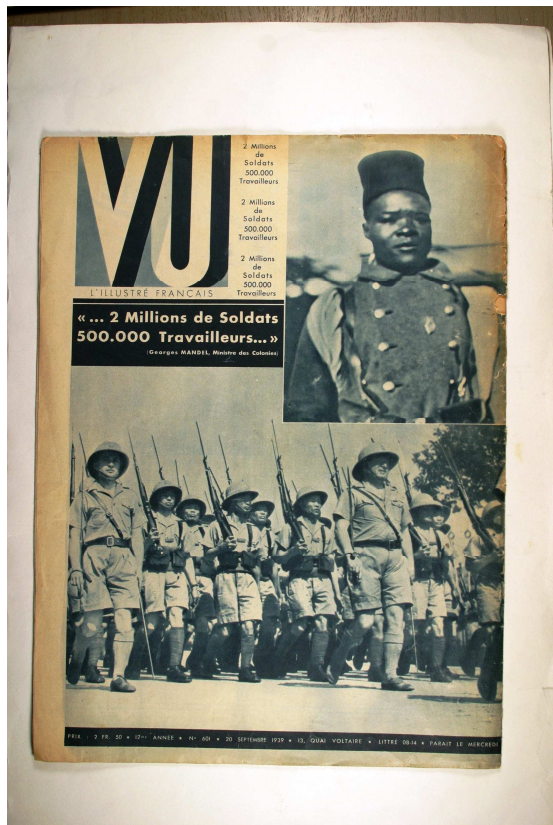
Couverture de l'hebdomadaire VU du 20 septembre 1939.